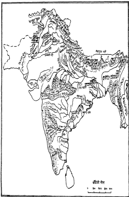
भारत के कुछ पर्वत एवं नदियाँ